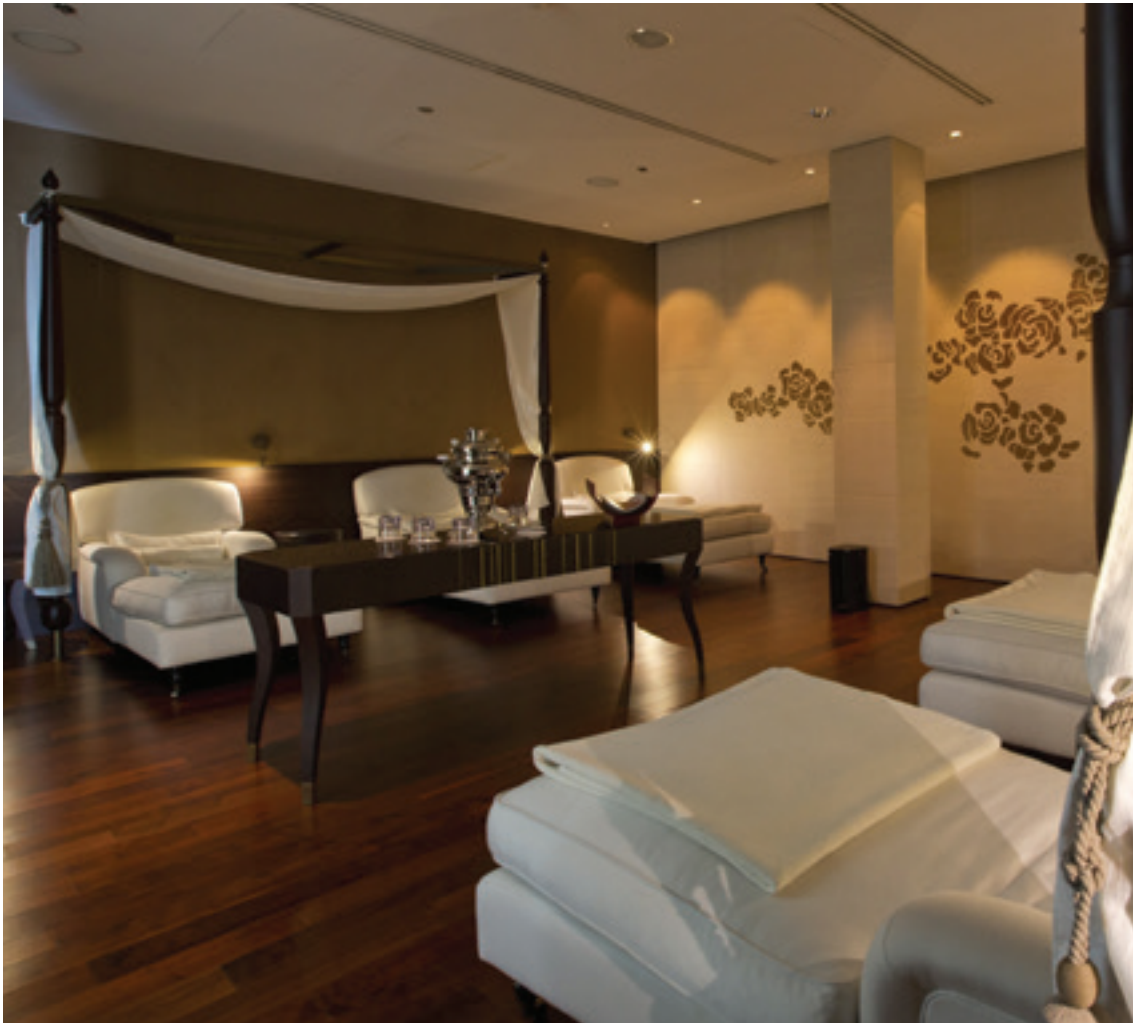
Tri procedúrne miestnosti Procedúrna miestnosť pre páry Alpha Sphere